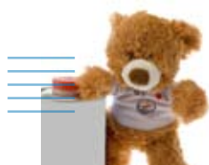
50 aniversario de Morelli