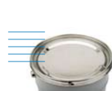
envase de 5 litros