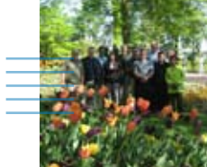
conferencia global de colores